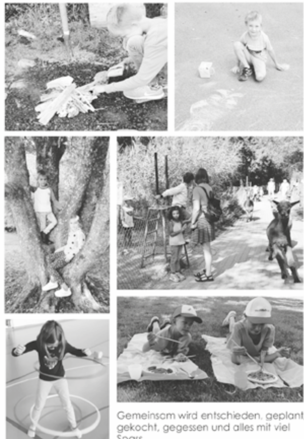
Gemeinsam wird entschieden, geplant, gekocht, gegessen und alles mit viel Spass.

FE rien- BE treuung LA upen für Kindergarten- und Schulkinder bis zur 6. Klasse