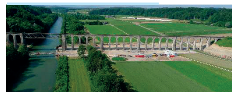
Aus alt mach neu: Der Saaneviadukt wird saniert und auf Doppelspur ausgebaut.

Infos zum Bauprojekt: bls.ch/saaneviadukt