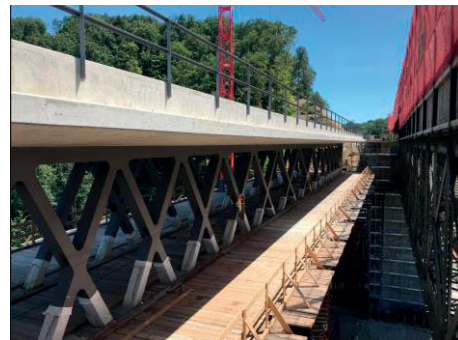
Nach der Demontage der alten Stahlfachwerkbrücke wird die neue Brücke an die definitive Lage verschoben.